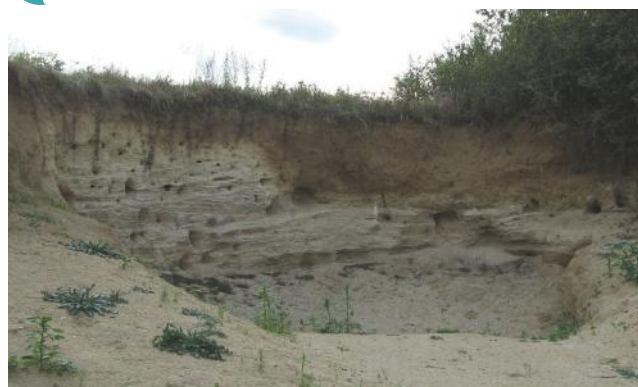
Fig. 2. Front ouest de la carrière. Le falun présente un beau litage oblique. La partie supérieure de la roche est altérée (couleur brune). Ce front est l'équivalent de la partie supérieure de front sud de la carrière du Four à Chaux (RNR Pontlevoiy).

La roche est un sable coquillier (= falun). Le faciès* pontilévien, mélange de sable siliceux et de coquilles calcaires, est très caractéristique ici. Il correspond à un dépôt marin côtier, voire littoral.